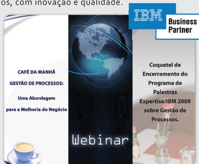
Eventos realizados com parceria IBM

Aguarde mais novidades para 2010. Continuaremos a apoiar nossos clientes a estruturar soluções que resultem na melhoria da performance de seus negócios, com inovação e qualidade.